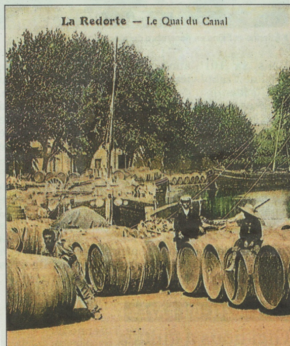
La Redorte — Le Quai du Canal

Aller ou retour seul : 10 €, aller-retour : 20 € sur réservation au 06 08 70 03 08 ou le jeudi sur place.