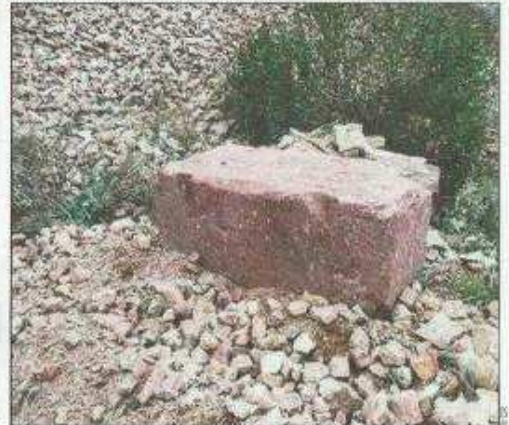
Le bloc découpé entre 1670-1676 sur le site de Villemausou