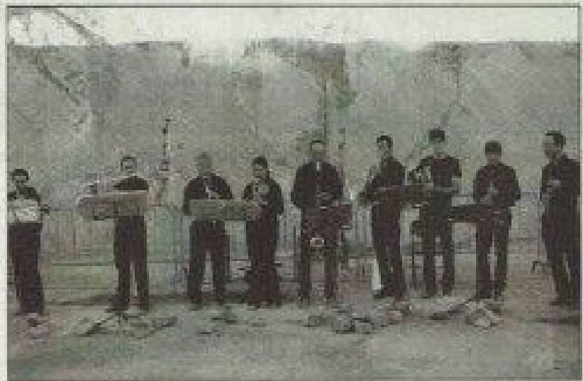
Les musiciens ont joué devant le front de taille incarnat.

C'est donc avec tantôt des extraits de musique de danse de l'Est, et des compositeurs comme Mozart, Paul Ducas avec "L'Apprenti Sorcier" qui a fait les beaux jours de Fantasia, que ce récital inattendu dans