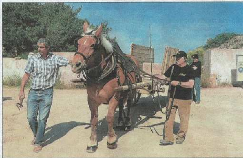
► Cette fois ça y est : un premier bloc destiné à Versailles a été déplacé jusqu'au Canal. Ch. B

■ Premiers essais Les étapes du périple commencent tout doucement à se préciser, après cinq ans de recherches, de mobilisations, de démarches administratives pas encore toutes abouties, de collecte de fonds. Ce mardi, un bloc d'environ une tonne est parti en charrette d'époque jusqu'à La Redorte où il sera chargé sur une gabarre, une péniche historique du canal du Midi, tractée par des chevaux depuis le chemin de halage. Avant septembre, la gabarre sera ainsi tirée jusqu'à Carcas-