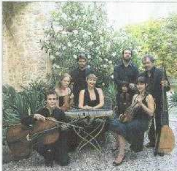
■ L'ensemble Opalescences mettra à l'honneur Josquin Desprez.

Le premier soir sera consacré à la musique renaissance avec l'ensemble vocal et orchestral Opalescences, qui mettra à l'honneur le compositeur Josquin Desprez (1440-1521). Le 23 août aura pour thème la musique italienne. Le quatuor Opalescences présentera ce soir-là "Histoire de Jephte", des œuvres baroques du XVII e siècle de Biagio Marini et Giacomo Carissini. Enfin,