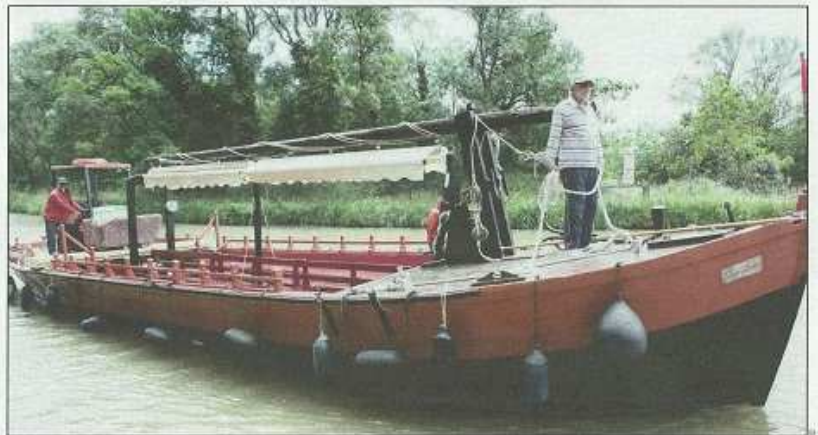
Chargée au Somail, la gabarre a créé la surprise en arrivant plus tôt que prévu au port La Fabrique. Spécifique au transport fluvial, ce bateau est une reconstitution fidèle du modèle traditionnel tout en bois appartenant à la société Cap au Sud.

C omme nous l'avions déjà mentionné dans nos pages, ce projet a commencé depuis la carrière de Villembert, en retrouvant un bloc de marbre taillé à la main au XVII e siècle. Selon des documents d'archives, celui-ci faisait partie d'un lot destiné à Versailles mais qui, pour une cause indéterminée, n'a