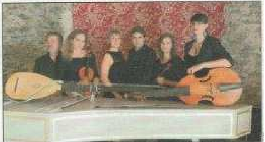
Le groupe "Opalescences" a ravi le nombreux public du festival

pass pour suivre les concerts de ce festival. Monsieur Fichow, directeur général de la préfecture a félicité les organisateurs pour leurs actions variées autour du thème du marbre et les a encouragés à passer à la vitesse supérieure en programmant dès l'an prochain un véritable opéra dans la carrière de marbre. Le défi est prêt à être relevé. À suivre... ■