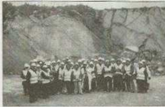
Le groupe des organisateurs à la carrière de Villerambert.