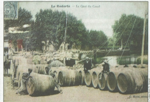
La Redorte - Le Quai du Canal