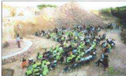
La musique baroque au cœur des carrières de marbres

P our un coup d'essai, c'est un coup de maître! Les 23, 24 et 25 août, trois soirées hors du commun à plus d'un titre. Le public était au rendez-vous: plus de 900 personnes pour entendre les chants mélancoliques de John Dowland et les airs sophistiques de H.P. Rameau. Le cadre épre de la carrière tranchait avec les accents humains du luth et de la viole. Il y avait un côté décalé dans le pon: du ghes et du caïque pour des raisons de sécurité. Tout le monde a joué le jeu avec une pointe d'amussement. Qu'il fasse une chaleur étouffante les deux premiers soirs ou bien des bourrasques de vent