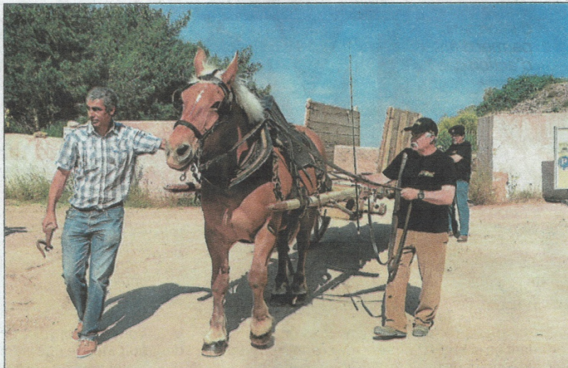
► Cette fois ça y est : un premier bloc destiné à Versailles a été déplacé jusqu'au Canal.

► Jeudi 13 juin, 15h, arrivée de la gabarre à la Redorte. Vendredi 14 juin, promenade en gabarre de la Redorte à Puichéric dès 9h.