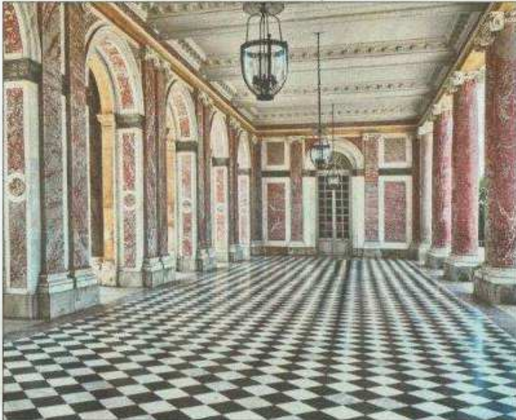
70% du marbre de Versailles provient de Caunes

une sculpture design. Un art que l'association MM replace au cœur de la production de marbre depuis quelques années avec des ateliers et un musée. "Versailles à son époque était un haut lieu du design, nous voulons renouer ces liens avec ce que nous faisons du marbre à Caunes." Les membres de l'association ont établi depuis quelques années un partenariat avec les conservateurs du château, sollicité la préfecture et la Région et recherchent encore mécènes et financeurs. "Il nous fallait écrire d'abord l'histoire", reprend le marbrier. ■