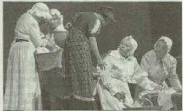
■ Les actrices du Grand Jaurès.

Jaurès sera alors en danger. En quittant les locaux de l'Humanité, le 31 juillet 1914, pour se rendre au café du Croissant, il sera assassiné par Raoul Villain, étudiant nationaliste.