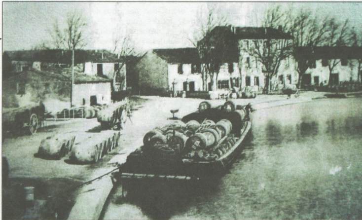
Il n'est pas si loin le temps où le canal du Midi servait de voie pour transporter les produits locaux

Tarif, aller ou retour seul 10 euros, aller-retour 20 euros. Sur réservation au 06.08.70.03.08 ou le jeudi sur place. Plus d'infos sur le site marbresenminervois.eu .