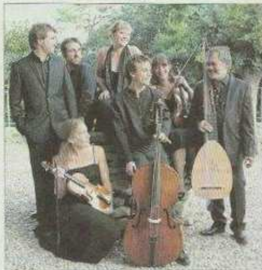
■ De la musique classique avec le groupe Opalescences.

C'est donc entre ces deux styles de dimension théâtrale que la tension sera la plus violente, puisqu'elle aboutira à